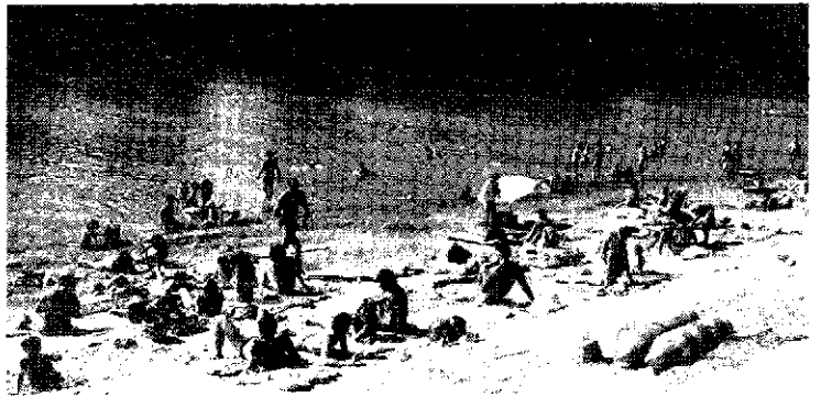
Nyári tiszapüspöki hangulat.

– Örülünk, ha megvalósulna, de erre törvényi lehetőség nincs egyelőre, mert az üdülőterületnek nincs állandó lakosa. Az minden további nélkül el tudnám vizont képzelni, hogy valamilyen önkormányzati formában üzemeljenek. Ez lehetne esetleg üdülőszövetkezet, vagy jogilag rendezhető más társasági forma is. Bízunk benne, hogy a Tisza-part által kínált igen kedvező feltételeket a jövőben még hatékonyabb formában fogjuk kihasználni, és akkor ta-