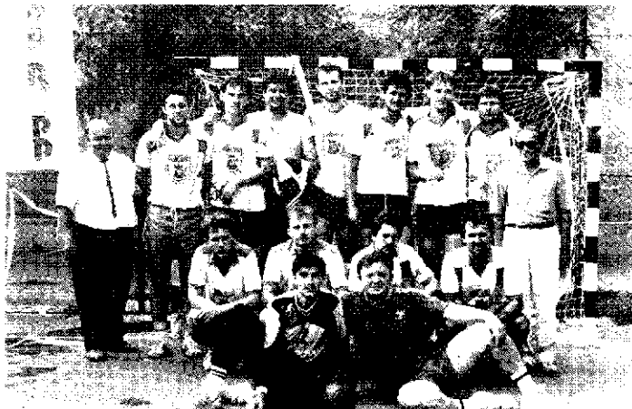
Az NB I/B-be bejutni könnyebb, mint támogatókat találni! Képünkön a bizakodó kézilélek.