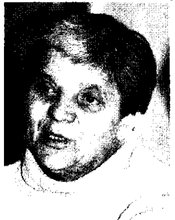
A mű és az alkotó is pihen

– Én arra a műre jogot már nem formálhatok, az a városé, legfeljebb abból az anyagból lehetne olyan szobrot fölállítani, amit valóban az itt élő emberek akarata alapján készítenék el. Szívesen ajánlám, bár a szobrászok nem szokták a műüket megsemmisíteni, én hajlandó lennék ebből az anyagból egy olyan szobrot készíteni, ami minden tekintetben megfelelné a város polgárainak.