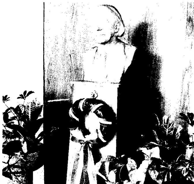
Felvételünkön a zeneiskola épületében a névadó, Kodály Zoltán mellszobra