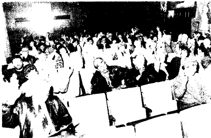
Szavaznak a küldöttgyűlés résztvevői

vagyonnevesítő akcióban 2.000 Ft-os üzletrészt. Az alapító tagok 5 db-ot, a régi tagok kettőt, a tíz éven belüliek egyet, függetlenül a részjegyeik számától. Most a '90. december 31-ig belépett új tagok is kapnak, de csak azok, akik eddigi részjegyüket 3.000 Ft-ra egészítették ki. A több részjeggyel rendelkezők minden kiegészített részjegyre 6.000 Ft-os üzletrészt kapnak. Dol-