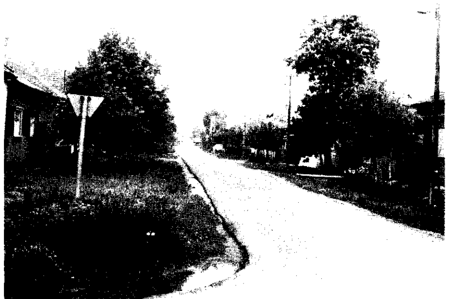
A Mártírok út nyílegyenes, az új burkolat viszont nem. Vajon kik csinálhatták? Ezen kívül már csak az a gond, hogy nem fér el két autó egymás mellett az aszfalon, mivel az a terv szerinti 5 méter helyett csak négy méter szélesre sikeredett.