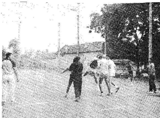
Az edzés egy pillanata. Így jó lesz a mérkőzésen is?

- Milyen szerepet játszottak a sikerben egyénenként a játékosok?