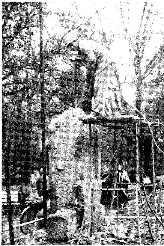
„Így múlik el a világ dicsősége...” Lebontották a szovjet hősi emlékművet a Kossuth téren. Ismét eltűnt egy alkotás városunkból, ami szomorú emlékeket őrzött!