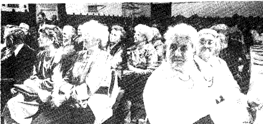
A Somogy megyei és a Jász-Nagykun-Szolnok megyei nyugdíjasok Ki mit tud-Ján résztvevők gálaműsorát rendezték meg november 29-én a művelődési központban. A nagyterem megtelt érdeklődőkkel, akik élvezettel hallgatták a fellépő előadókat.