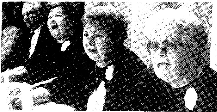
Még a közönség asztalánál a tiszakürti trió.