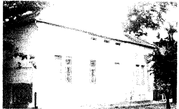
Az új múzeumot már több éve tatarozzák. Talán jövőre elkészül.