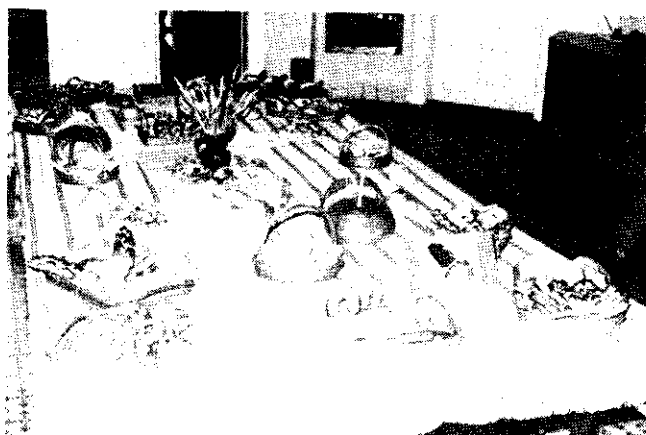
A Közép-Alföldi Sütődék Vállalat termékbemutatója a művelődési házban a kalászfőző pályázat kiegészítőjeként (1991. augusztus 20.)