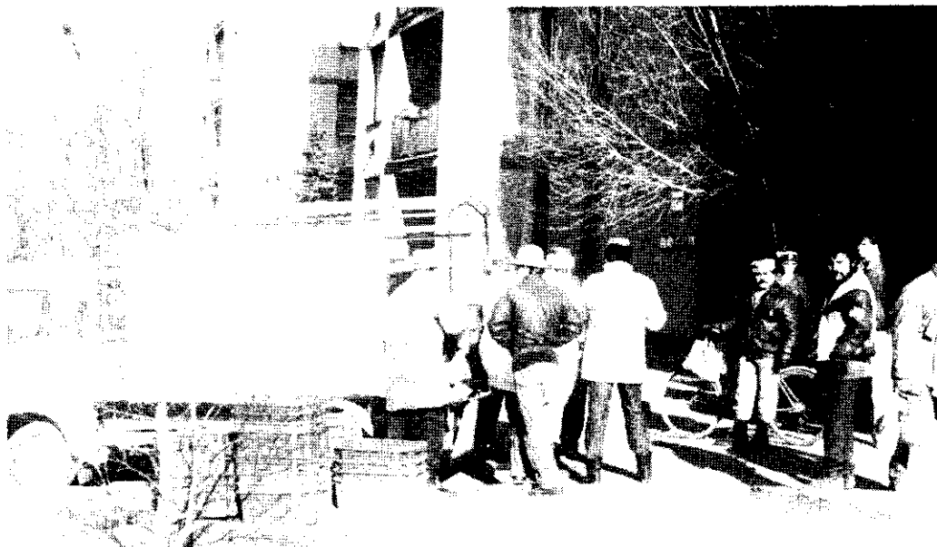
1991. január 28.: Tejdemonstráció