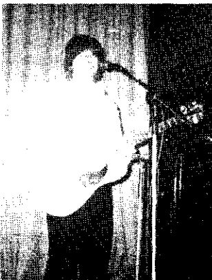
A dalok lényege ugyanaz marad.

- Nem tartom magam pesszimistának. Teller Edének van erről egy na-