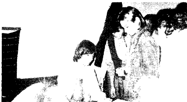
„Nagyon sokszor hallok a mostani tizenévesektől, hogy de szeretnének fiatalok lenni” - mondja Bródy János, aki a koncert végén autogramot adott kedvelőinek.

- Viszonylag mozgalmas évem volt az idei. Két olyan nagylemez is megjelent, amelyet részben a magaménak tekintek. Az egyik a Koncz Zsuzsáé, a másik Halász Jutkáé. Tudod, a Vannak még rossz gyerekek. Ezeknek én írtam a szövegét, én voltam a producérük is. Aztán most úgy alakultak a körülmények, hogy mire a lapotok megjelenik, már piacon lesz egy kislemezem, amelyik egyik