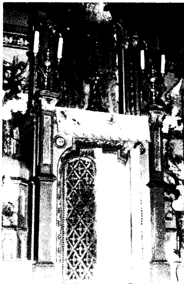
Betörték a katolikus templomba. A felfeszített tabernákulum ajtaja.