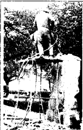
1991. november 30 - december 2. A szovjet emlékmű-bontás utolsó pillanatai

Sindel Mihályról készült portré a hetedik oldalon.