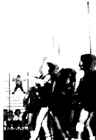
Berkics a Székács ellen. A Magyar Bajnokságot nyert Szolnoki Olajbányász a mezőgazdasági szakközépiskola diákjai ellen játszott a Székács csarnokában