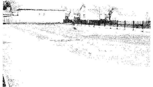
A Kőlcsey sportudvara még avatás előtt