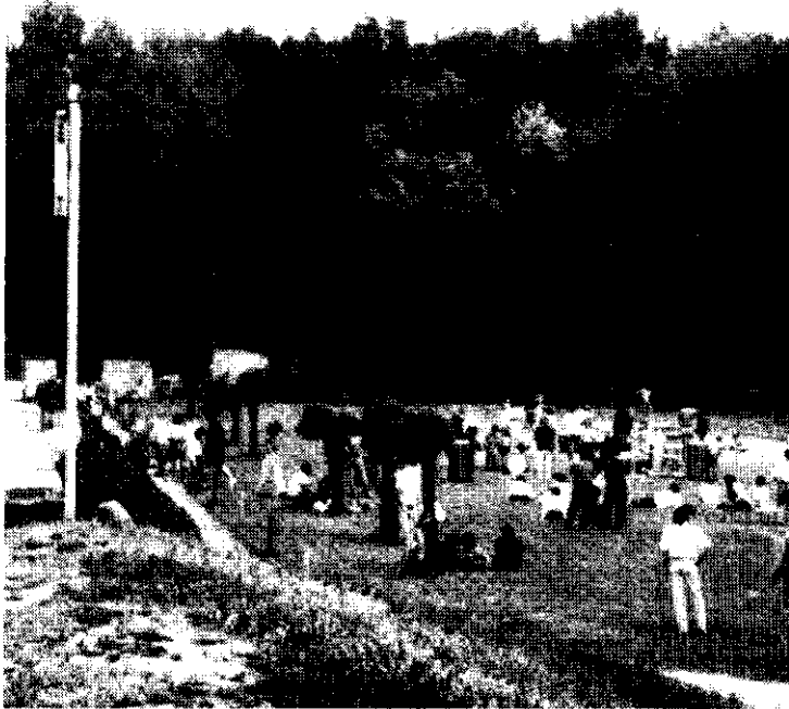
A művelődési központ juniálisa a sportpályán