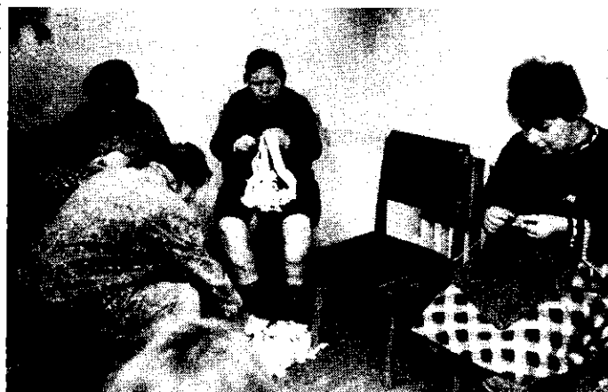
KÉSZÜLNEK A SZŐNYEGEK, FÜGGÖNYÖK...

- A teljesen laikusokra gondolva szerencsés volna azt is tisztázni, miérettel betegekkel kerülnek ide emberek, mi az intézmény funkciója. A nem teljesen avatatlanok számára pedig azt, mi a különbség az elmeorvosgyógyintézet, a psi-