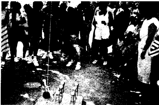
ELMEBETEGEK ORSZÁGOS OLIMPIÁJÁNA A TEKÉZŐK

- Az eddig elmondottak az "elmeszociális" elnevezésből csak az első részre derítet-