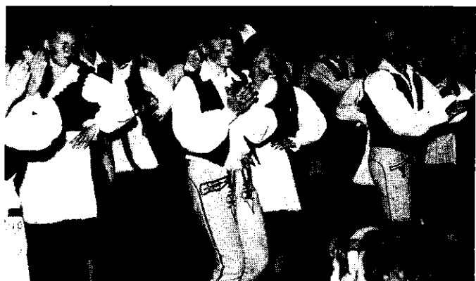
Fürge lábak ropják a táncot

Köszönjük a vállalatoknak, az intézményeknek az anyagi és emberi segítséget.