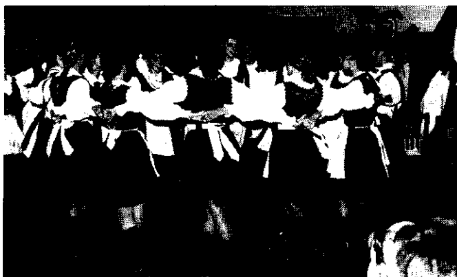
A barcasági guzsalyos kedves leánytánca