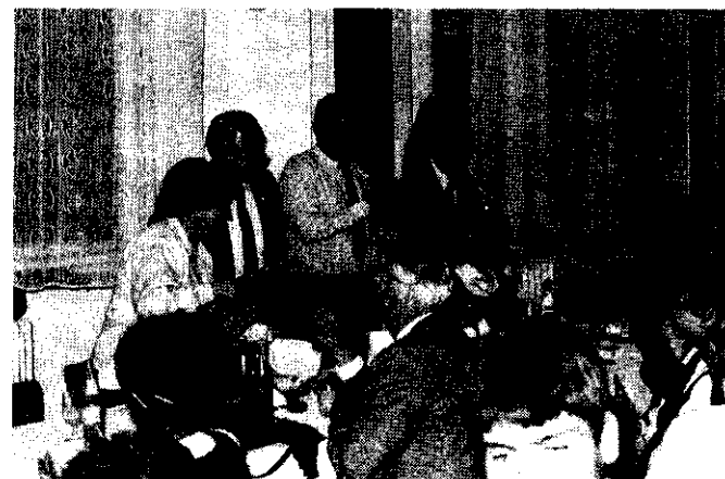
A líceum tanárnője átadja az iskola évkönyvét. Mellette az RMDSZ küldöttség tagjai és az MDF elnöke