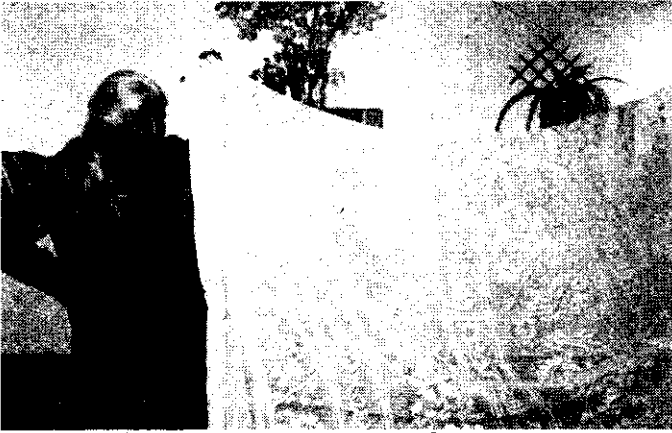
...S A VÉGEREDMÉNY IGAZI MESTERMŰ

- Van még egy specifikumunk, ezt is jelzi a nevünk. Alapvetően olyan elmebetegek kerülnek ide, akiknek az otthona, a szociális környezete olyan, hogy nem tudja befogadni, tolerálni őket, vagy nem tud róluk kellően gondoskodni. És itt jön a tudatlanság vagy álságosság miatti sommás "diliház" kérdése.