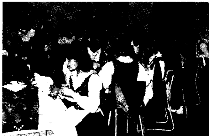
Közös vacsora a vendégekkel