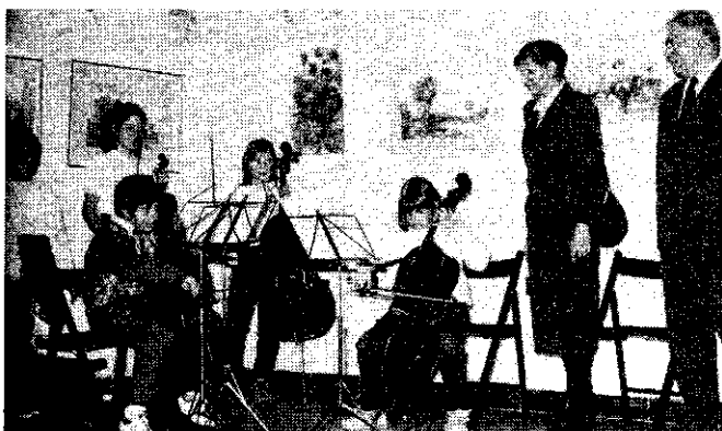
A zeneiskolások kamarazenekara műsort ad.

Örömmel üdvözölte a kezdeményezést akkor, mikor a kultúra esélyei gyengülni látszanak, és reális veszélyként leselkedik sokakra a lelki és érzelmi elmagányosodás!