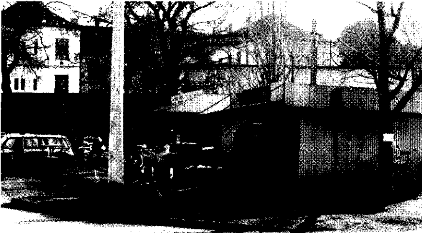
Ha még ez is eltűnne innen...

tartozékokkal, elhelyezni a szeméttárolókat, asztalokat, s ki kellett alakítani a működési rendet. Ezután a bérlők megkapták a működéshez szükséges hatósági engedélyeket. Most már valóban minden készen áll az ünnepélyes felavatáshoz, amelyre - ez már egészen biztos, február 26-án 16 órakor kerül sor.