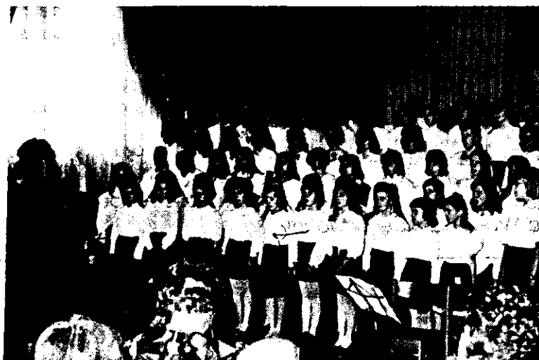
A Petőfi Sándor Általános Iskola leánykórusa

tánciskola indult a 8. osztályosoknak, éppen az énekkari próba napjain. Ez a legnagyobb elvesztését jelentette, pontosan a felkészülés heteiben. A kieső létszámot nem lehetett pótolni.