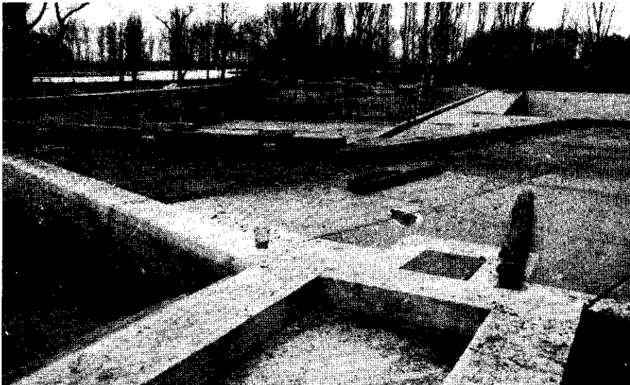
Nem kell megjedni a látvány már csak egy-két hétig tart.

- Mostanra a gyógymedence is teljesen fel-