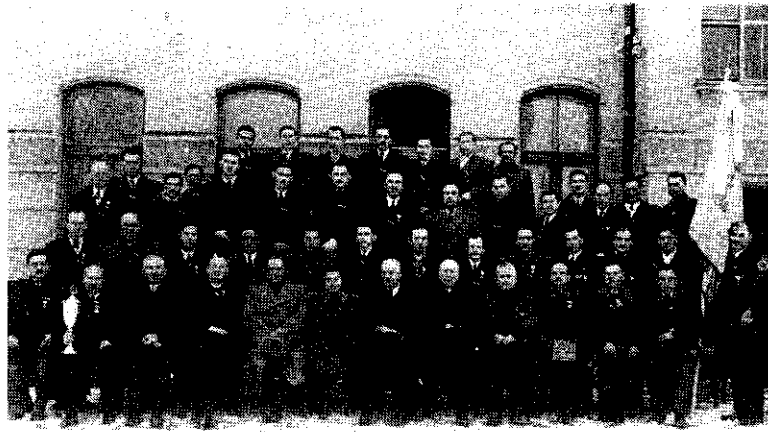
A törökszentmiklósi Dalárda 50 éves jubileuma 1948