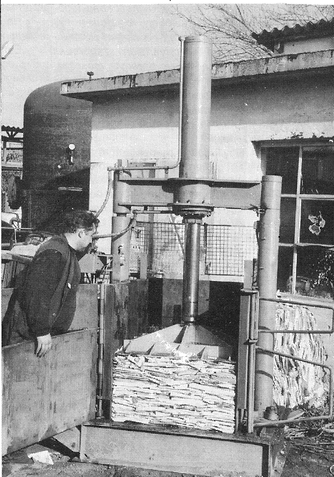
Az üzemben előállított papírprés

Bedolgozói munkákat is vállalunk. Büszkék vagyunk például arra, hogy a magas minőségű termékeket előállító MEZŐGÉP is dolgoztat velünk, de más termelőegységgel is kapcsolatban állunk. Így pl. a helyiek közül még a Hűtőgépgyárral, a Taurinával, de az örményesi Hunniwar Kft-vel, illetve egy szegedi és egy budapesti céggel is. Tehát megtartottuk az eredeti profilt, s bár egy-két korábbi exportlehetőséget örököltünk, a jelenlegi széleskörű kapcsolatrendszer már mi alakítottuk ki. A fő szállítói németeken kí-