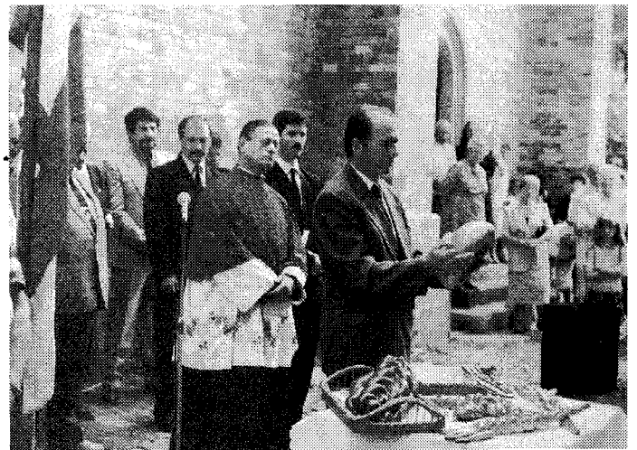
Felkérjük a polgármester urat, hogy legyen az új kenyér meg-„Szegő”-je

– A hívő katolikusok mindig megünnepelték Szent István királyt. A rendszerváltás után a legfőbb nemzeti ünnepünk lett ez a nap, és ezzel kapcsolatban az önkormányzat elképzelése szerint, a katolikus egyház készséges hozzájárulásával a katolikus templom terén történik a nemzeti ünnep megünnepelése, első szent királyunk megünnepelése, immár hagyományosan. Az ünnep a katolikus templomban a 10 órás nagymi-